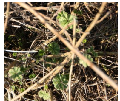
Pflanzenrosetten in den Startlöchern zum Wachsen: Die Wilde Karde, die Wiesen-Margerite und die Wilde Malve warten auf das Frühjahr